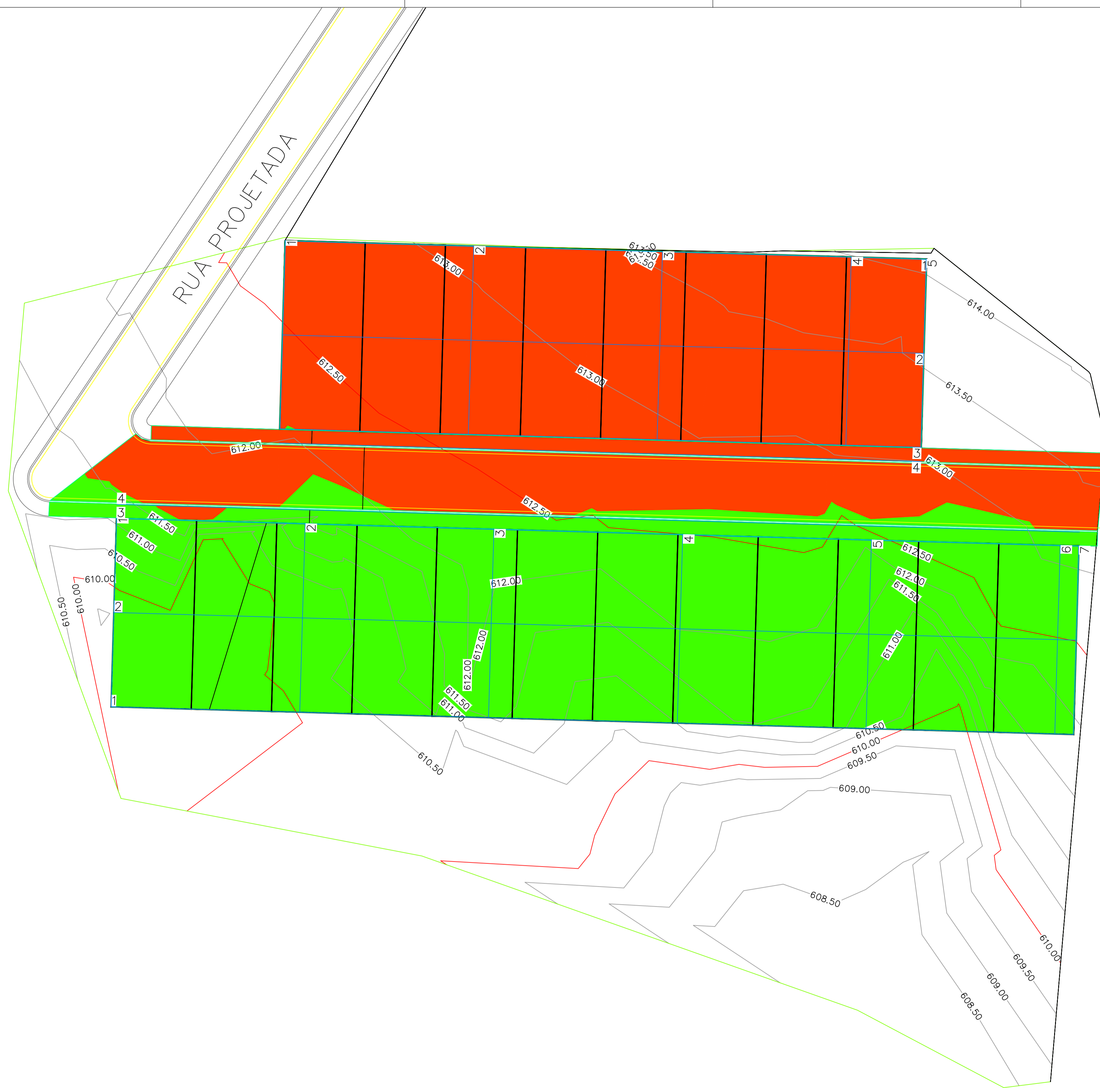
01 TERRAPLANAGEM ESCALA 1:250