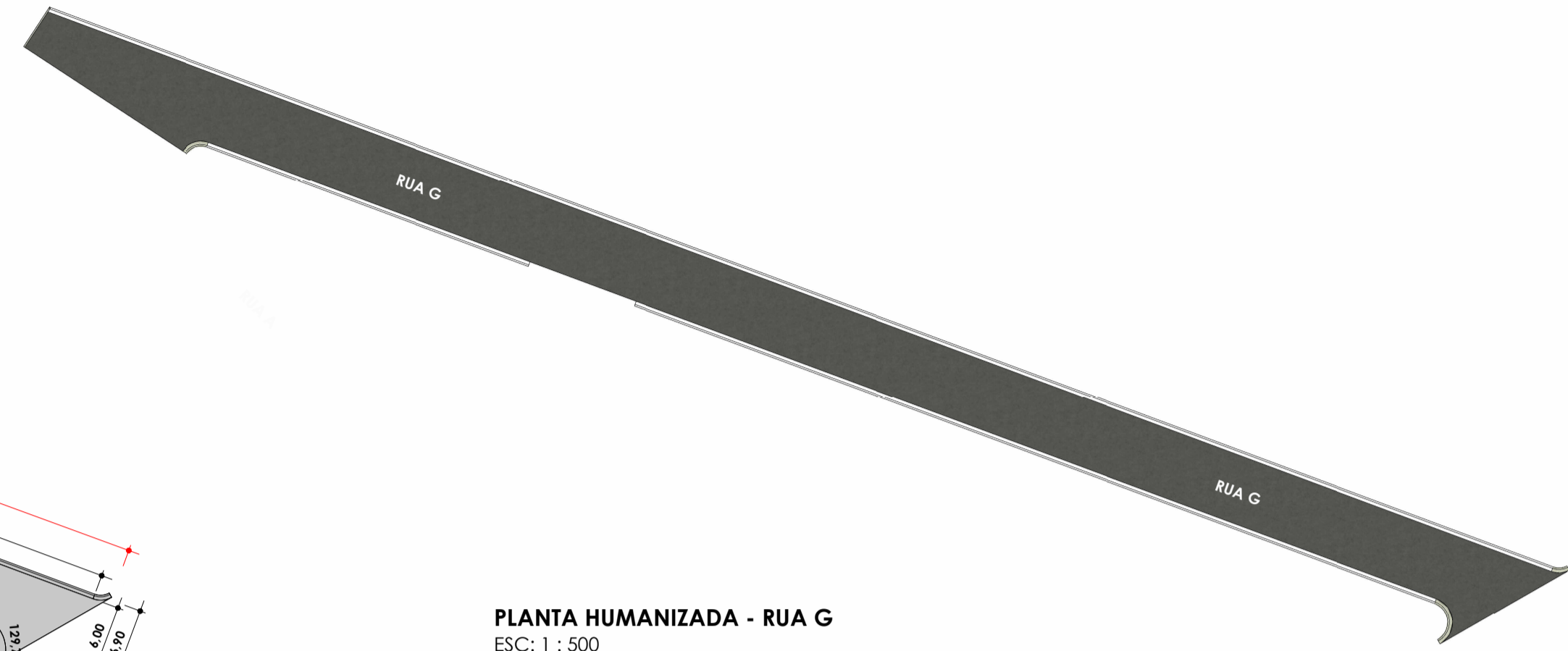
PLANTA HUMANIZADA - RUA G ESC: 1 : 500