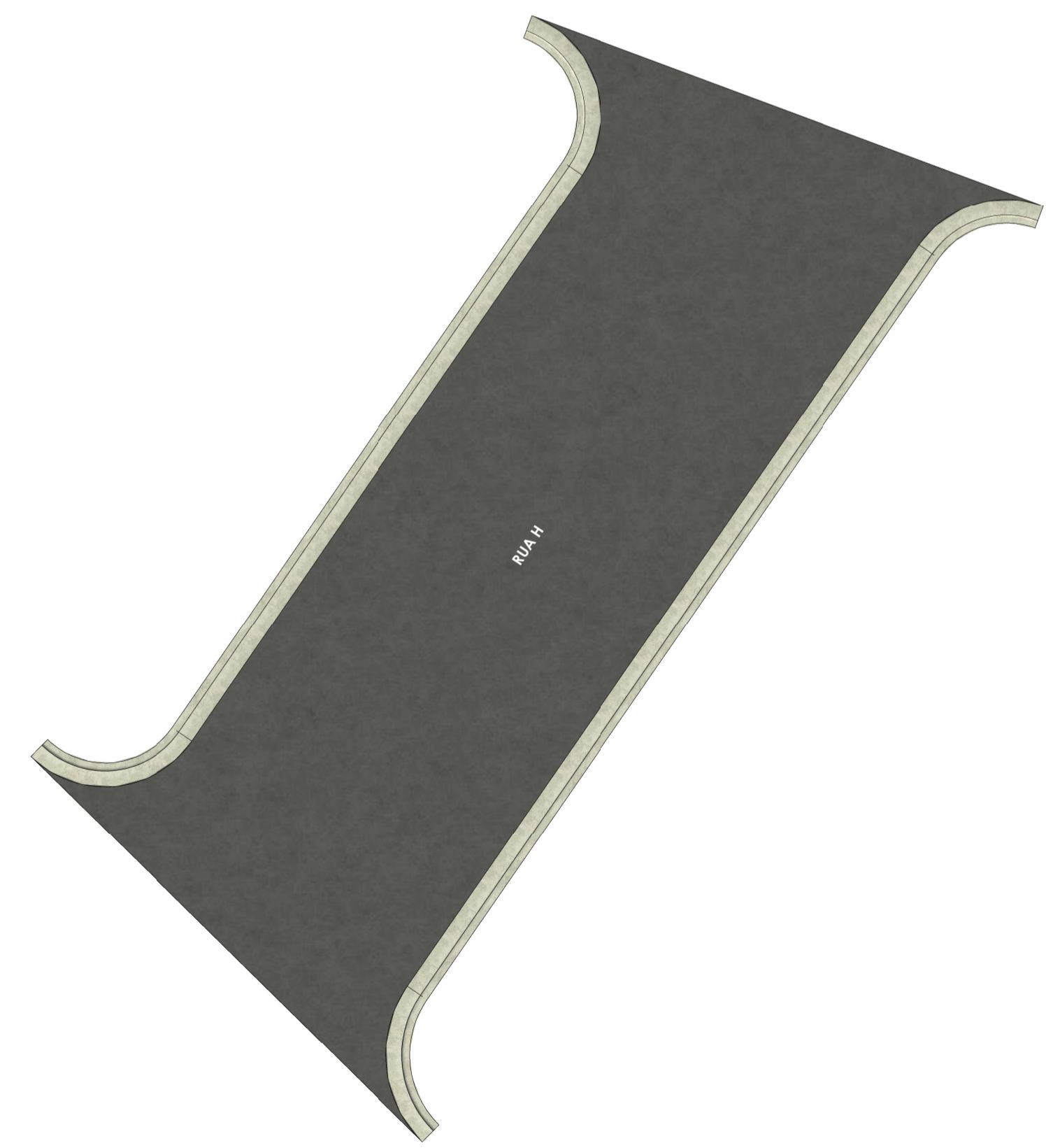
PLANTA HUMANIZADA - RUA H ESC: 1 : 100