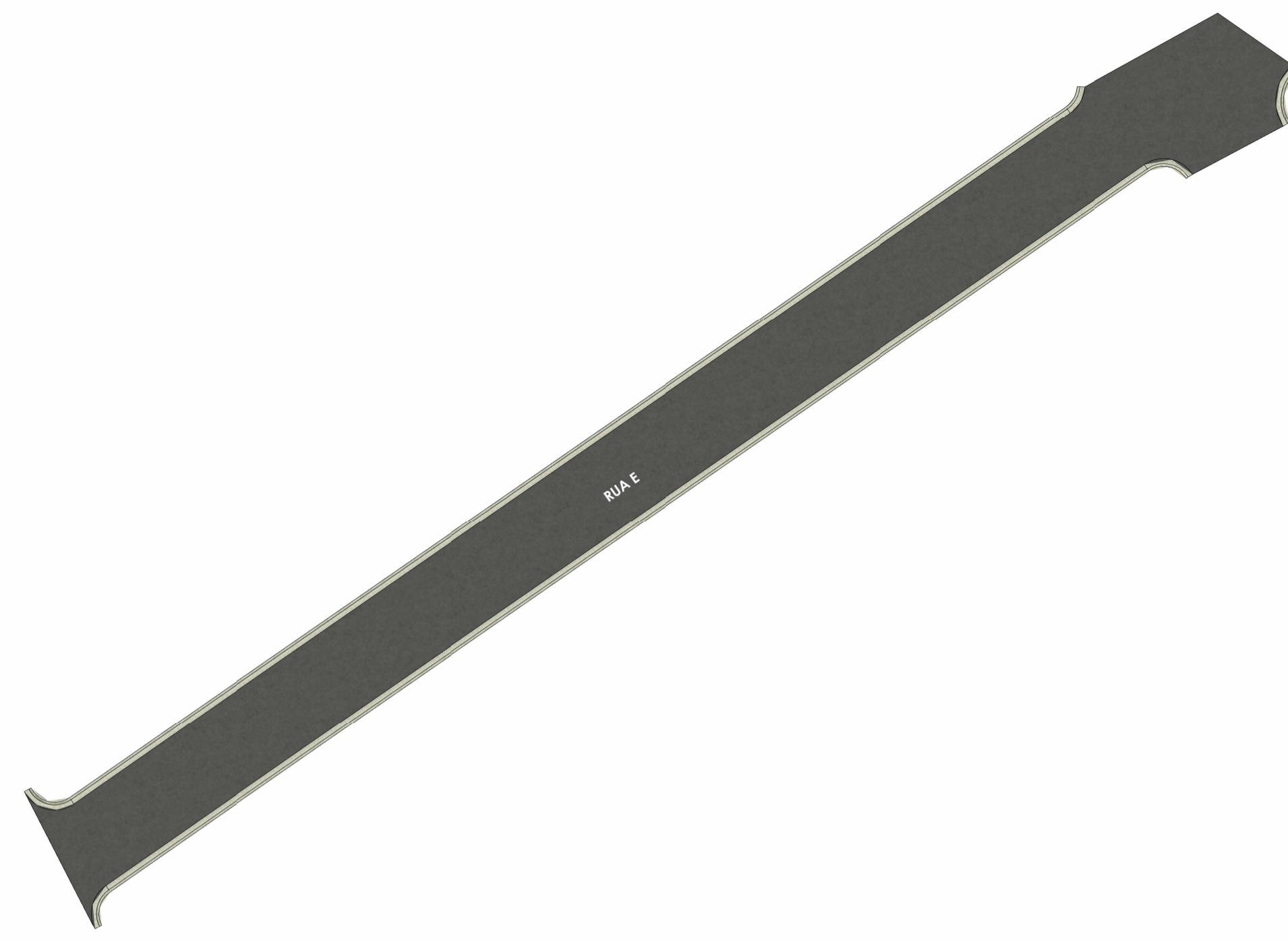
PLANTA HUMANIZADA - RUA E ESC: 1 : 300