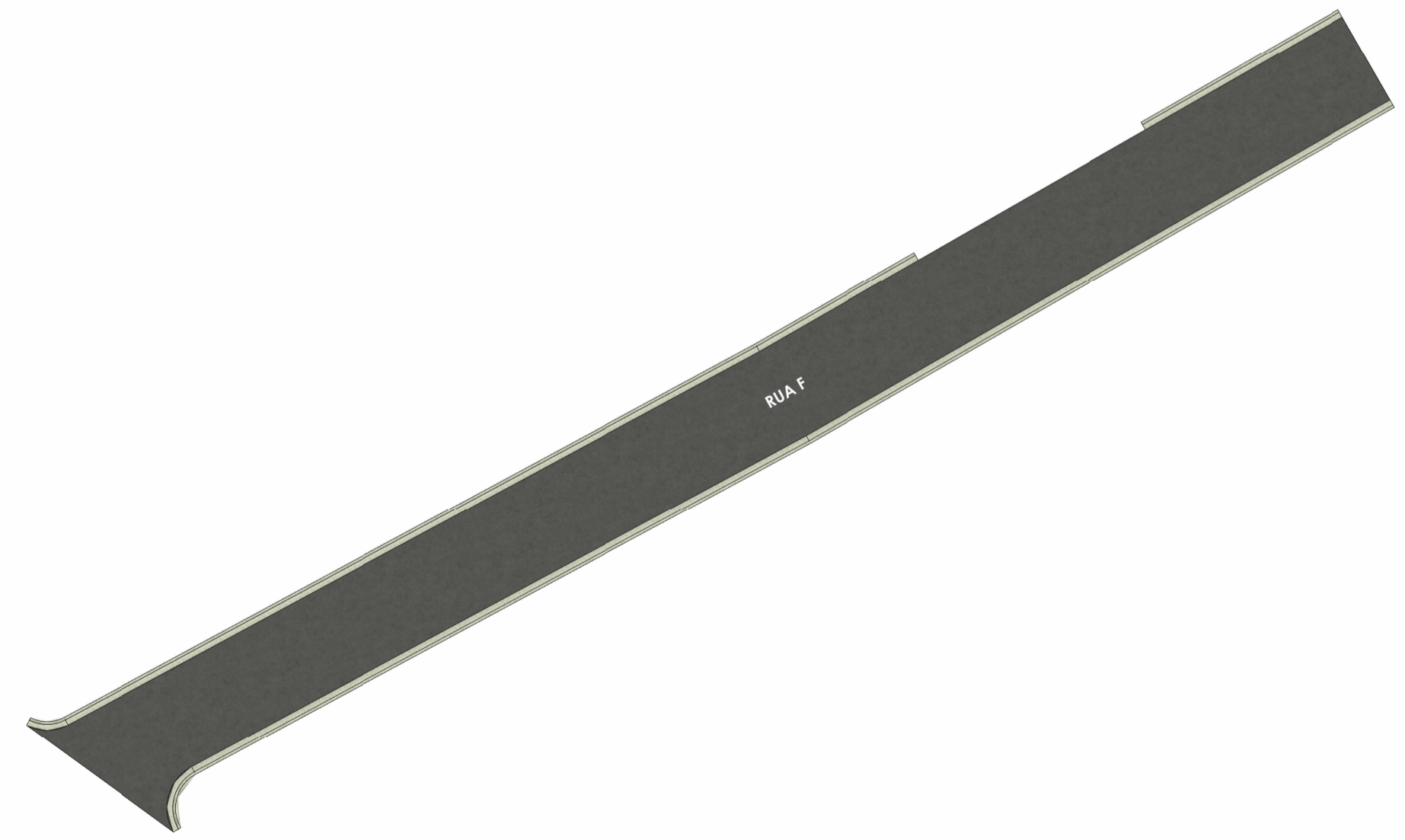
PLANTA HUMANIZADA - RUA F ESC: 1 : 300