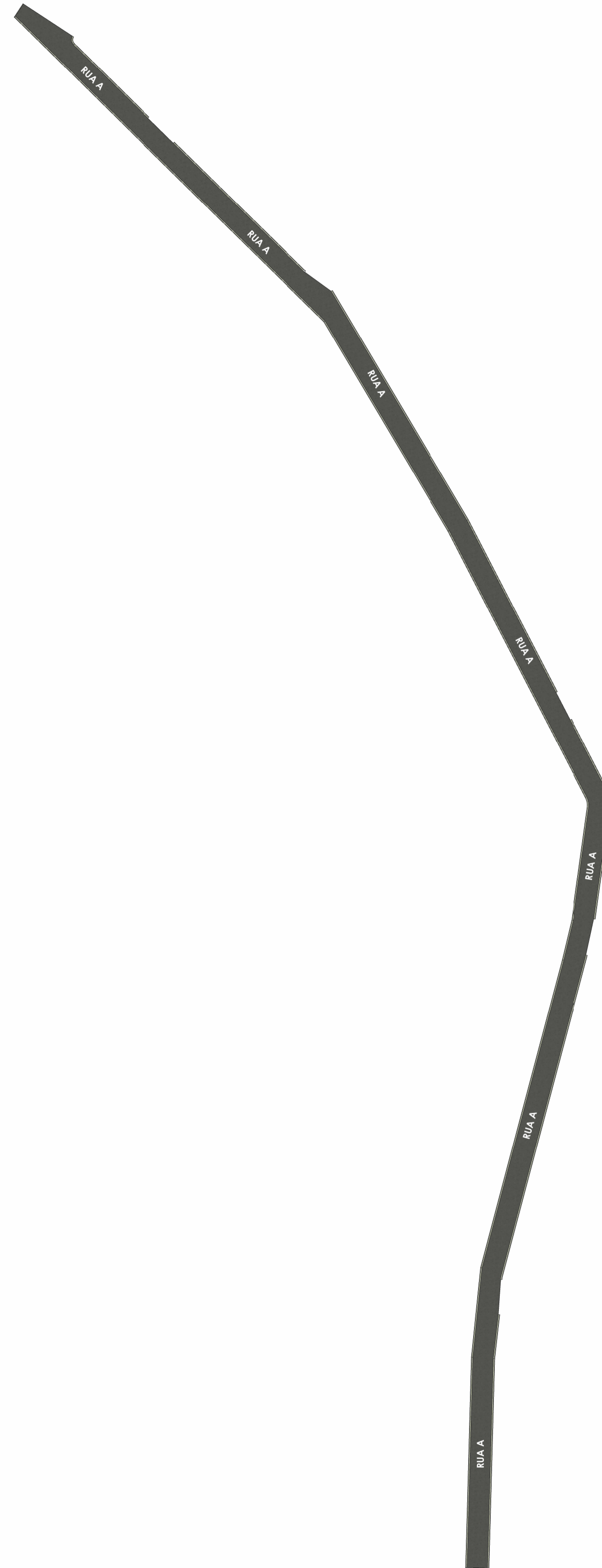
PLANTA HUMANIZADA - RUA A ESC: 1 : 1000