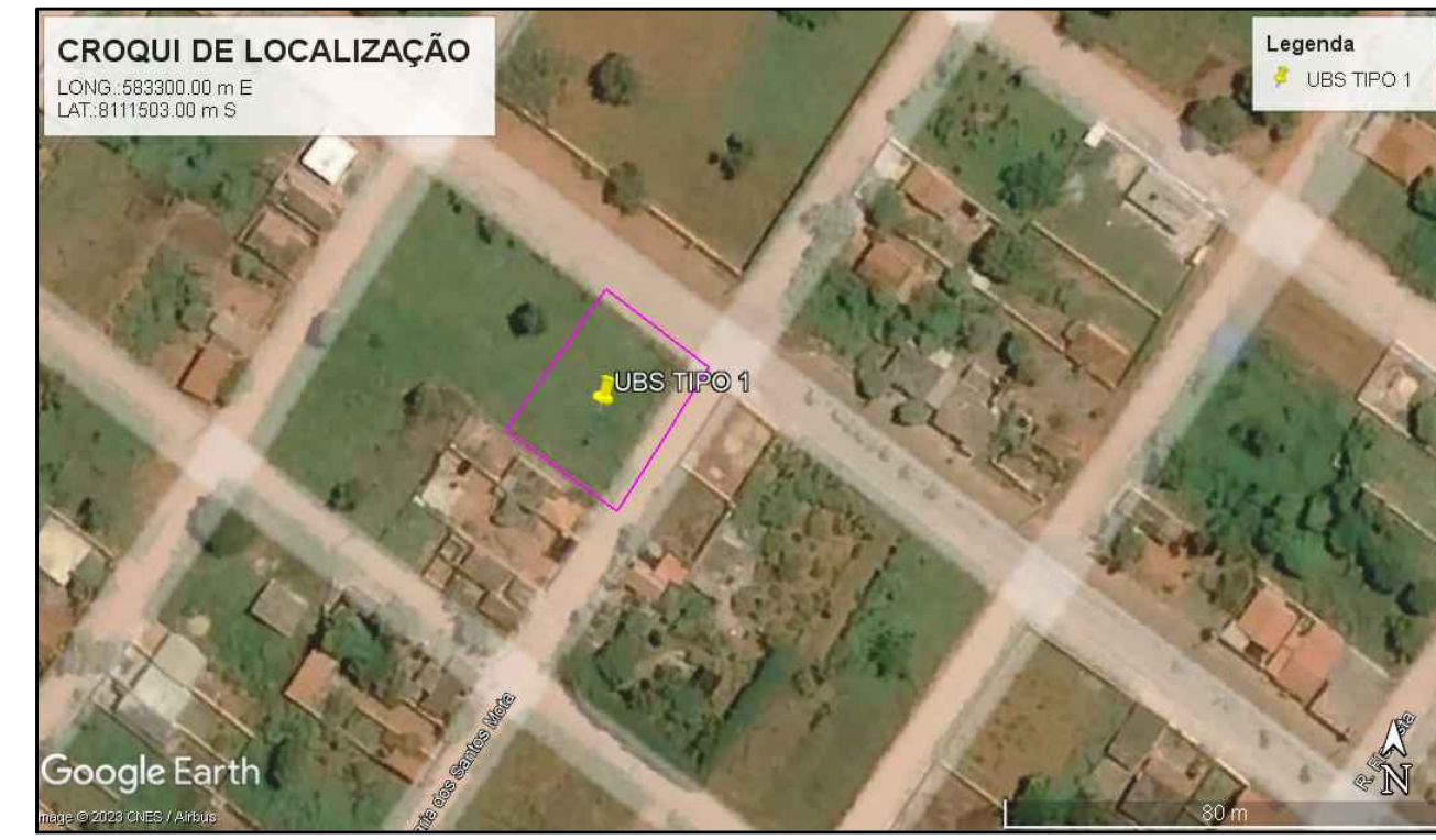
CROQUI DE LOCALIZAÇÃO ESCALA 1: 250 UBS PADRÃO ALVENARIA – TIPO I