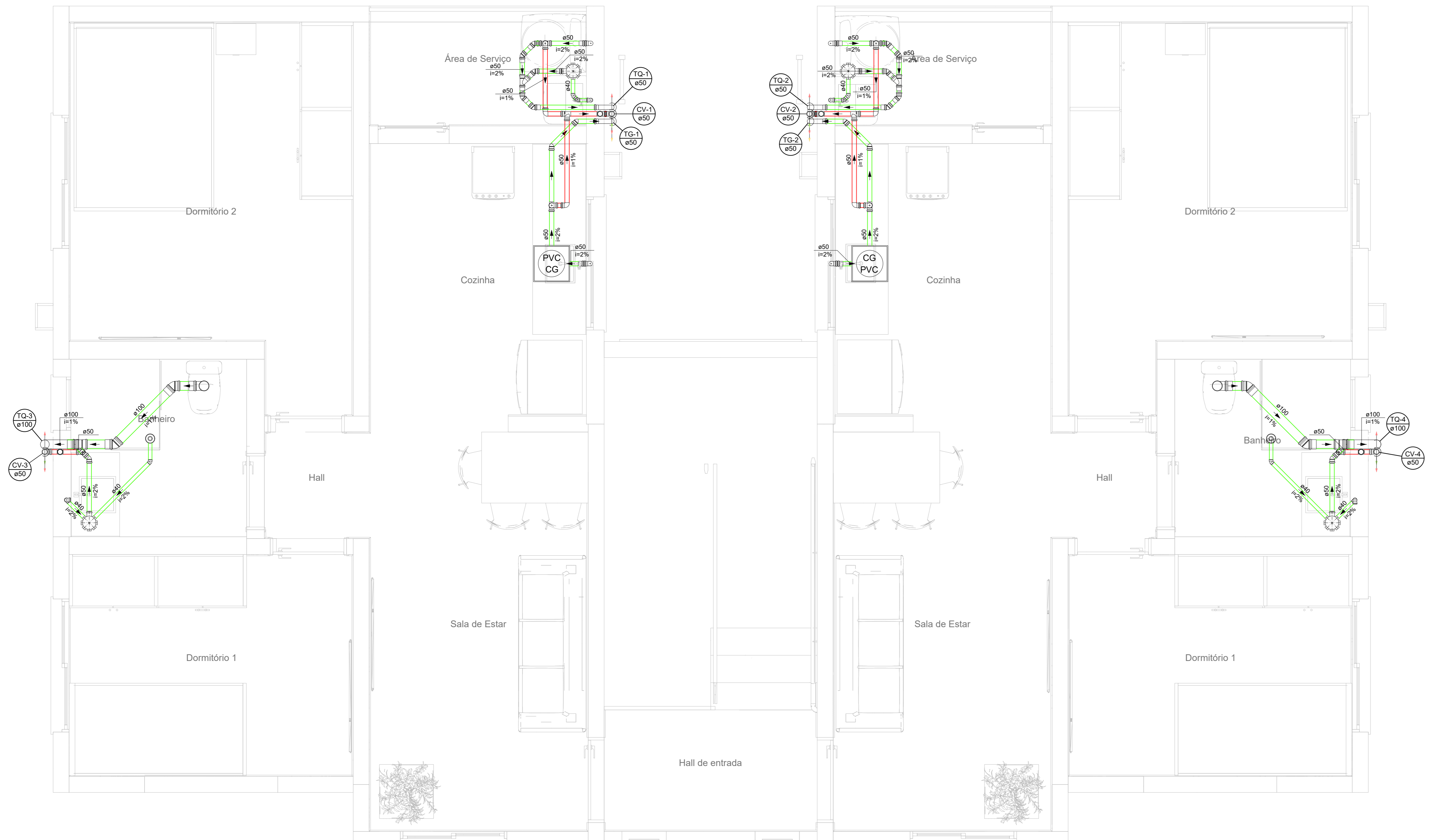
04 PLANTA DO 3º PAVIMENTO ESCALA 1:100