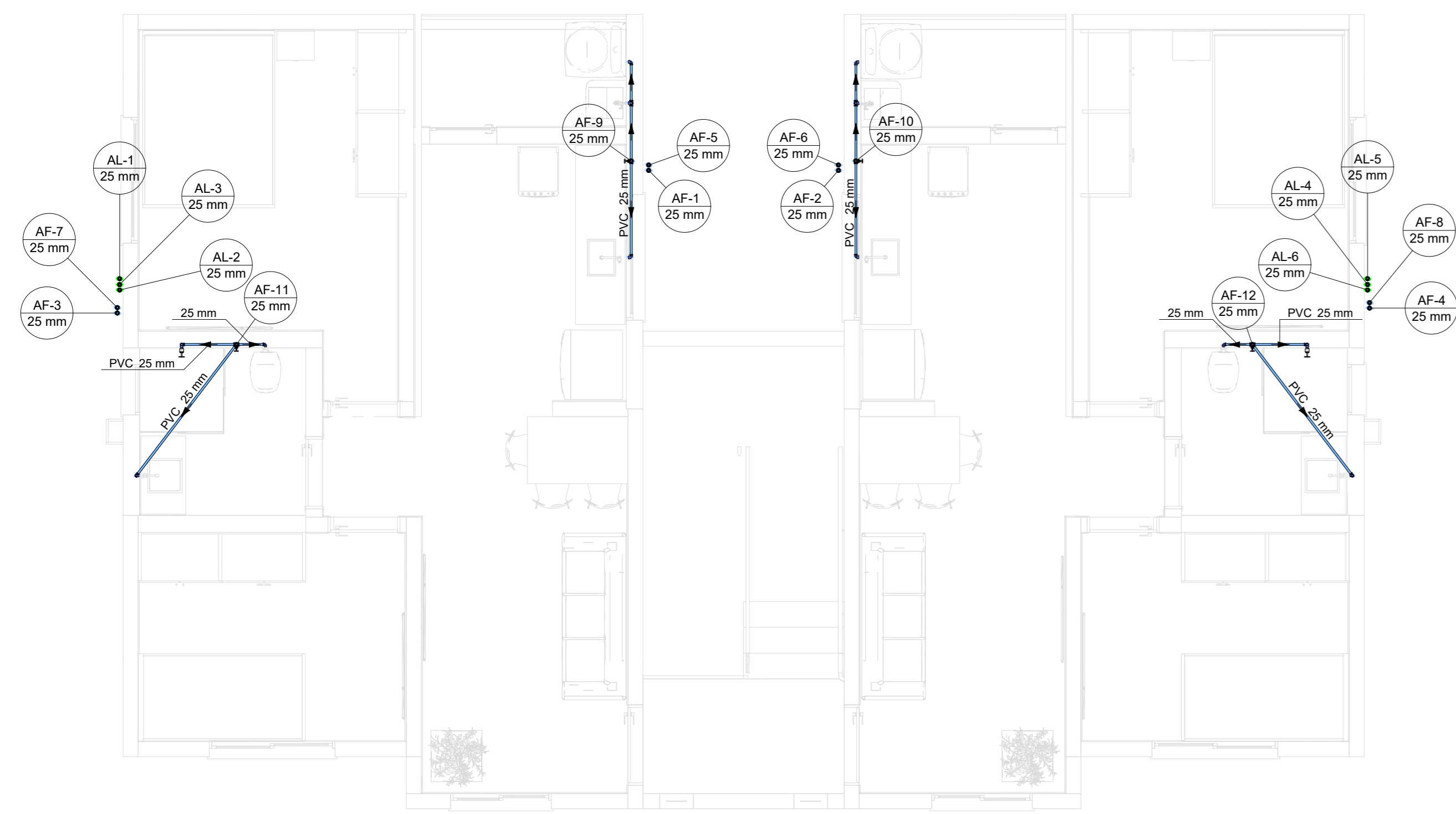
5 PLANTA BAIXA - 3º PAVIMENTO ESCALA 1:100