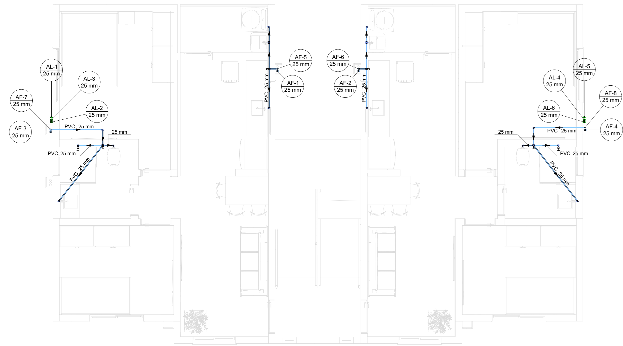
3 PLANTA BAIXA - 2º PAVIMENTO ESCALA 1:100