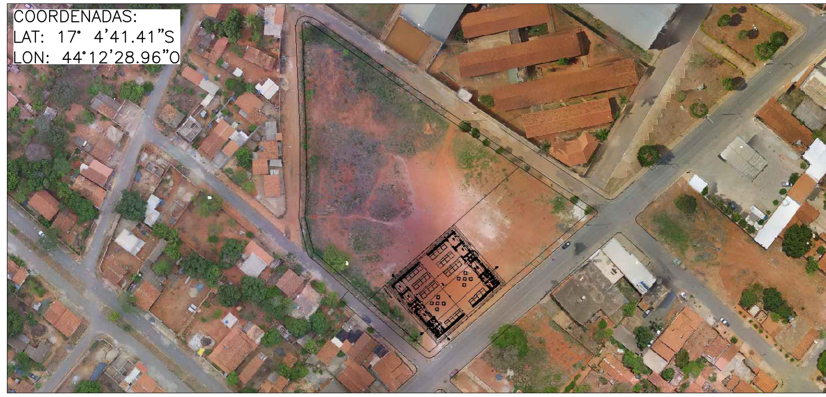
1 CROQUI DE LOCALIZAÇÃO SEM ESCALA