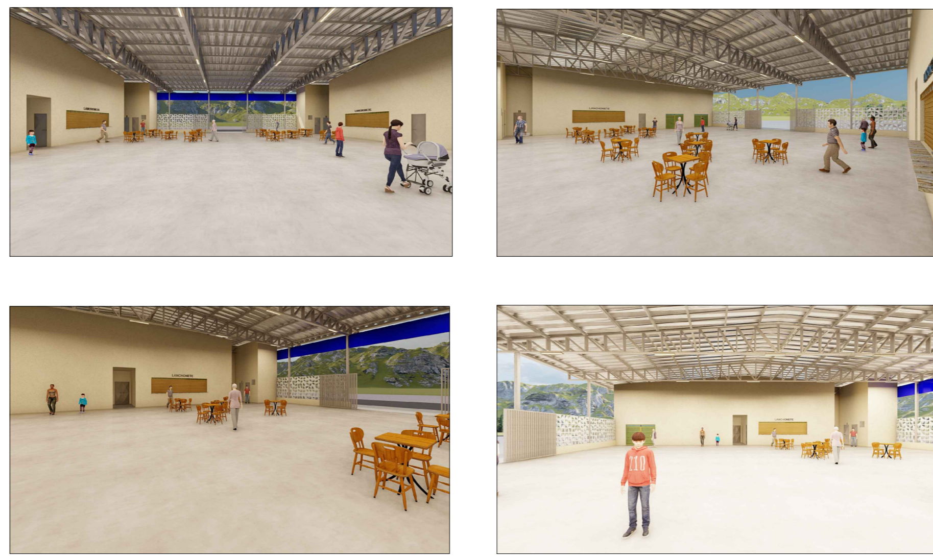
4 IMAGENS ILUSTRATIVAS SEM ESCALA