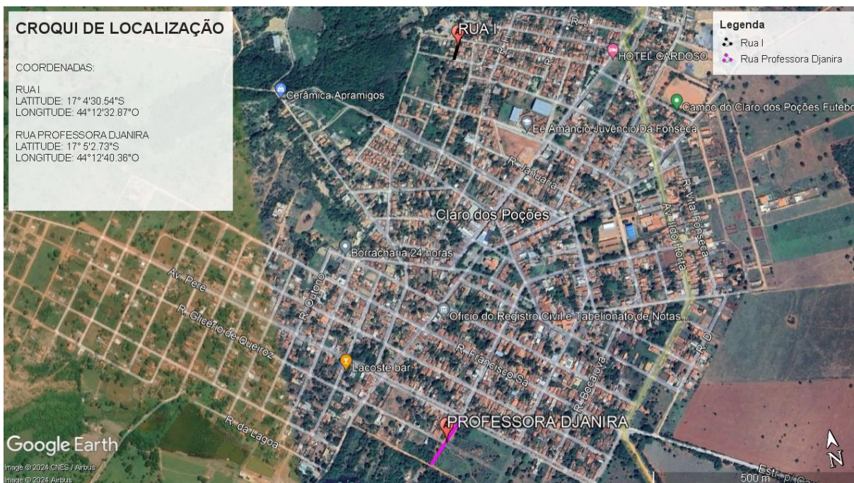
Imagem: Croqui de localização das vias.