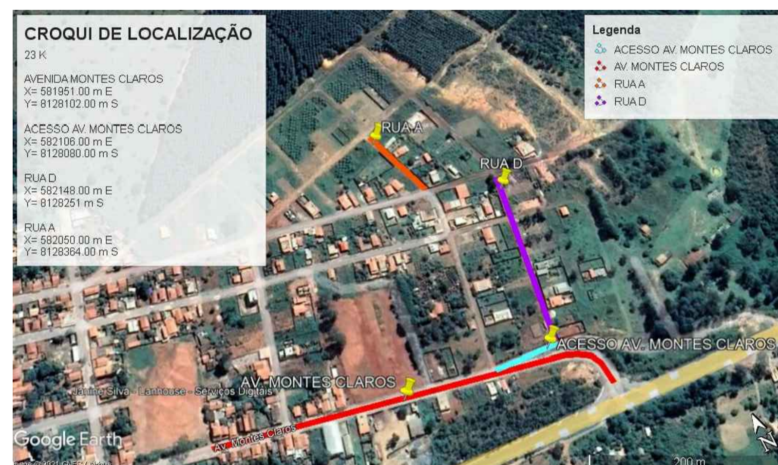
04 CROQUI DE LOCALIZAÇÃO SEM ESCALA