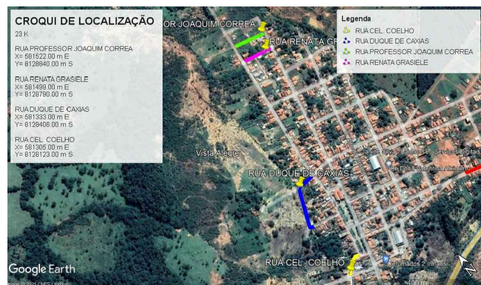
05 CROQUI DE LOCALIZAÇÃO SEM ESCALA